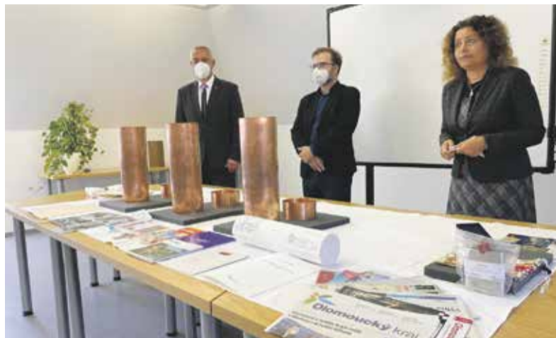
Tři schránky obsahují původní historické materiály i nové předměty z letošního roku.

Mezi uloženými předměty byl mimo jiné zapečetěný vzkaz budoucím generacím, aktuální tisk, fotografie, upomínkové předměty Olomouckého kraje i knihovny, mince nebo plány rekonstrukce Červeného kostela. Nechyběla ani placatka slivovice či respirátor. Podle památkářů a historiků by se pouzdra mohla opět otevřít zhruba za sto let.