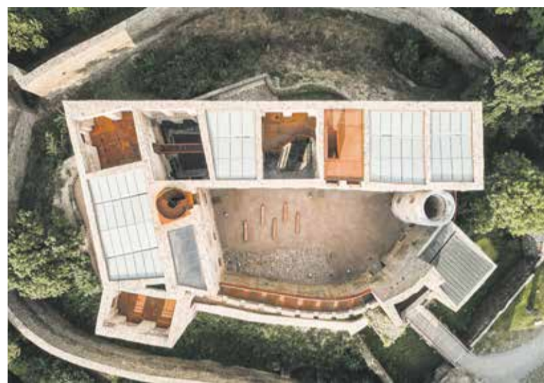
Hrad Helfštýn má za sebou rozsáhlou rekonstrukci, kterou prošlo celkem 11 torz místností. Ty slouží jako průchozí a výstavní prostory.

celkovou opravou. Od poloviny loňského srpna se stal novým turistickým lákadlem regionu. O kompletní rekonstrukci a zá-