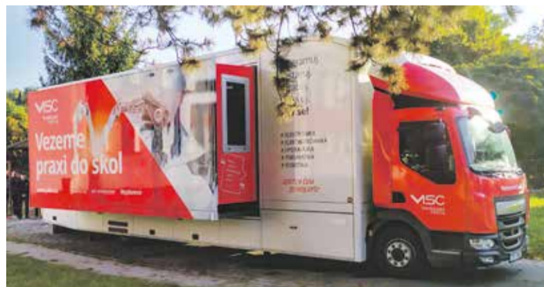
Kamion s virtuální realitou ukázal studentům i učitelům nové možnosti výuky.

Neustálý rozvoj digitalizace, automatizace a robotizace nutí i střední školy nezaspát a postupovat podle nejnovějších trendů. „Digitalizace a robotizace ovlivňuje a bude ovlivňovat průmysl stále více. A bez nejmodernějších výukových pomůcek bude čím dál obtížnější připravit mladé lidi tak, aby ihned po