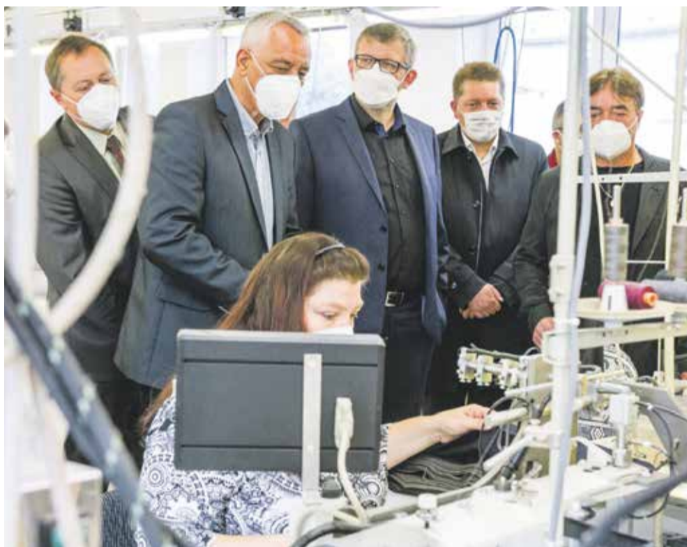
Krajští radní navštívili na Konicku výrobce textilu a diskutovali se zástupci podnikatelů, obcí i neziskového sektoru.

Soukromníky zastupovali na jednání například dopravci, výrobci textilu, strojního vybavení nebo oken. Radní