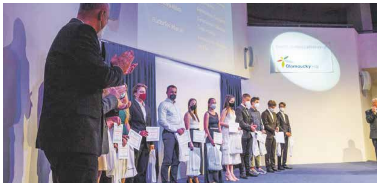
Talentovaní žáci z celého kraje převzali ocenění hejtmanství v olomouckém RCO 11. října.