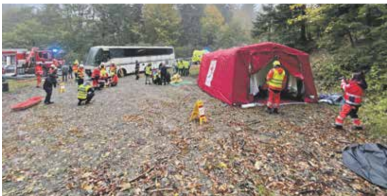
Námětem cvičení byla havárie autobusu se školáky. Po vyproštění cestujících museli hasiči prohledávat i okolní les, pomáhal jim dalekově řízený dron.