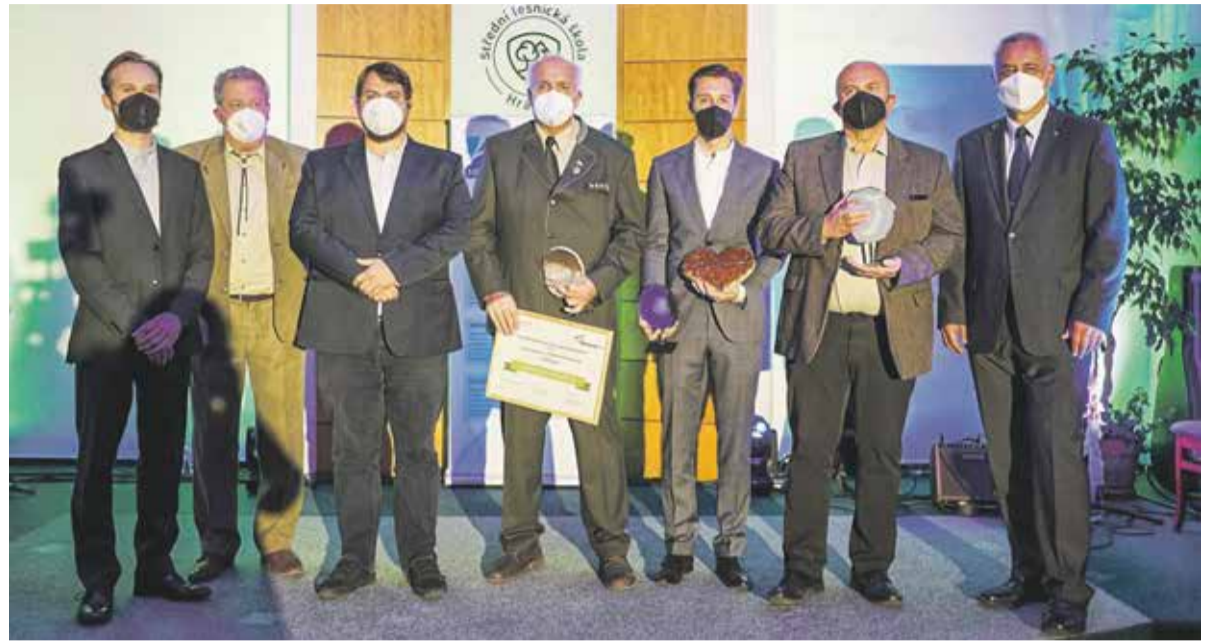
Udílění cen se konalo 20. října v lesnické škole v Hranicích. Podrobný seznam všech nominovaných i jejich medailonky nabízí webové stránky cenykraje.cz.