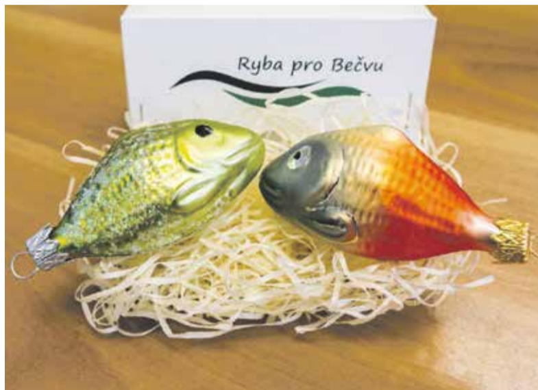
Skleněné vánoční ozdoby jsou vyhotoveny ve dvou barevných provedeních a vyráběny ručně.

„Loňská událost na řece Bečvě se řadí mezi největší ekologické havárie v novodobých dějinách Olomouckého kraje. Nápad vsetínského družstva IRISA se nám líbil natolik, že jsme se rozhodli nakoupit ozdoby za přibližně třicet pět tisíc korun. Jako vánoční dárek je věnujeme našim partnerům. Jde o smysluplný projekt, jehož přidanou hodnotou je radost