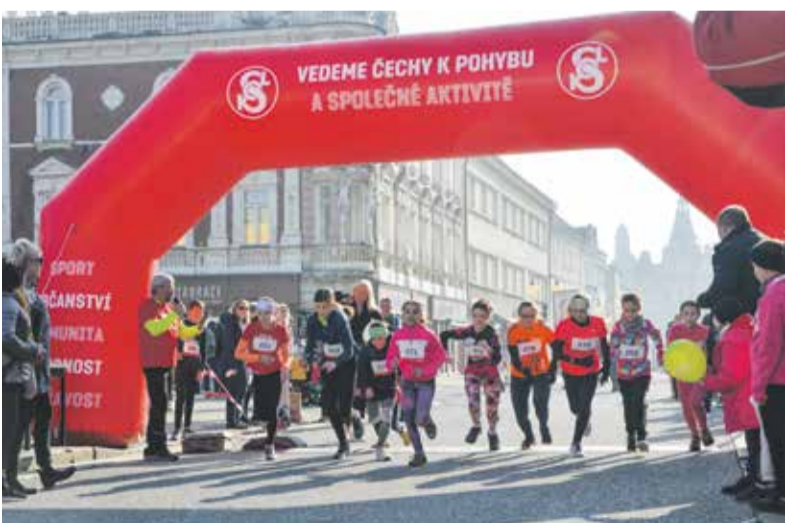
V Olomouckém kraji se kromě Prostějova závod konal také v Přerově a Náměšti na Hané na Olomoucku.

Ryze sportovně si Sokolové v Prostějově připomněli výročí vzniku samostatného Československa. Ve čtvrtek 28. října se jich na běžeckou trať centrem města vydalo okolo tří stovek. Vítězem hlavního závodu na deset kilometrů se v kategorii mužů stal Bronislav Khýr, v kategorii žen se z první příčky radovala Tereza